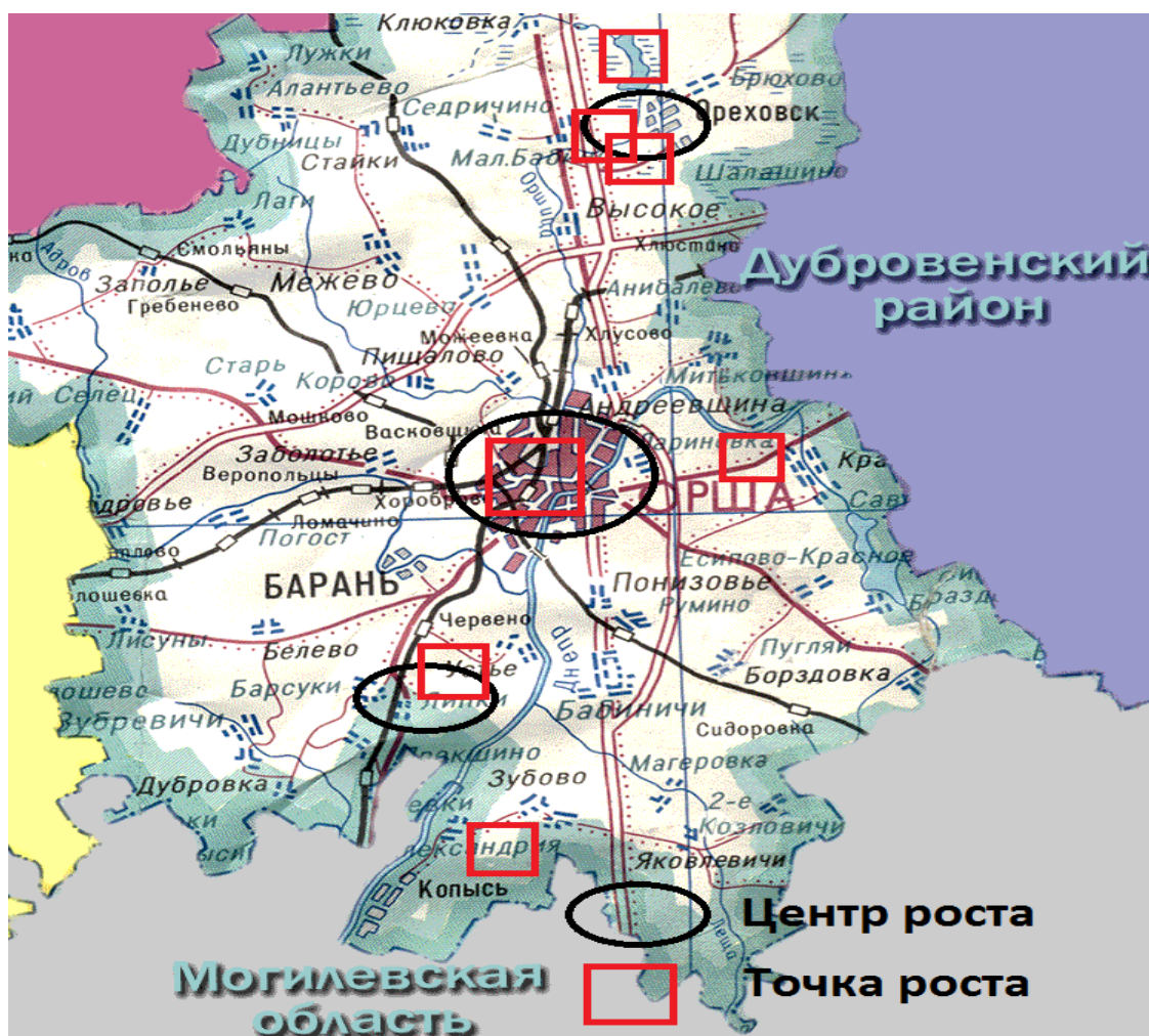
Рисунок 3 – Размещение точек и центров роста Оршанского района

В силу особенностей района основным географическим центром роста является г. Орша. Вторичными центрами могут стать г.п. Болбасово и г.п. Ореховск (рисунок 3).