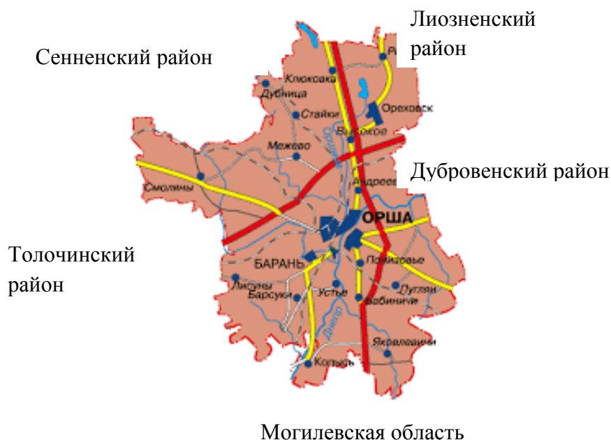
Рисунок 1 – Карта Оршанского района

Район расположен в юго-восточной части Витебской области, имеет выгодное транспортное сообщение – пересечение двух трасс международного значения: М-1/Е-30 и М-8/Е-95. Граничит с Лизненским, Дубровенским, Толочинским и Сенненским районами, а также с Могилевской областью. Находится в 78 км от областного центра и в 201 км от г. Минска. В административно-территориальную структуру района входит 17 сельских советов, 3 поселка городского типа. Административный центр – г. Орша.